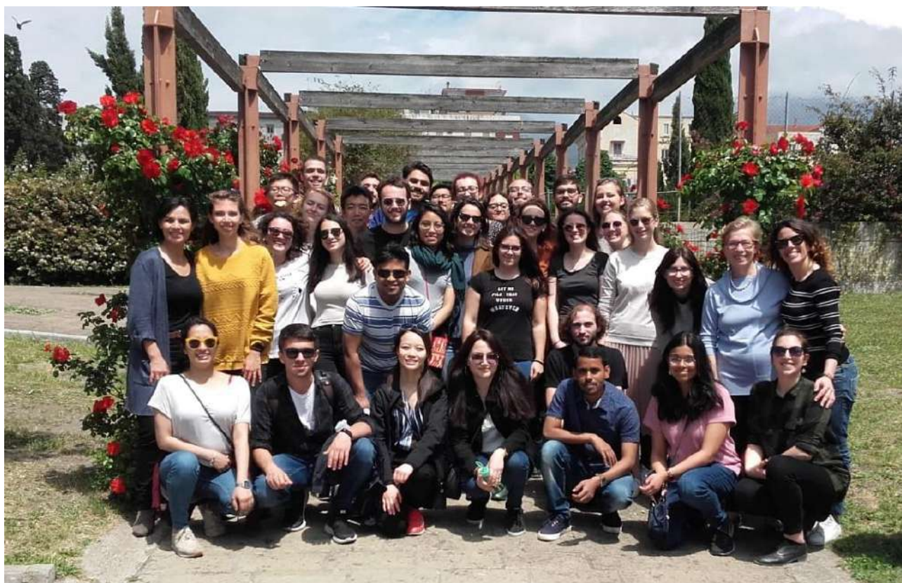
Studenti Erasmus Mundus CLE di Bologna - Viaggio di istruzione a Napoli